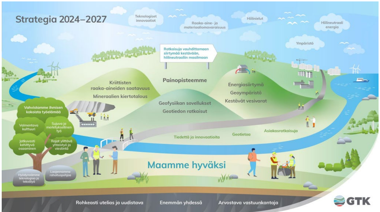
Kuva 2. GTK:n strategia 2024–2027.

GTK:n tarkoitus on Maamme hyväksi – For Earth and for Us. Tuotamme geotieteelliseen ymmärrykseen pohjautuen yhteiskunnalle ja yrityksille ratkaisuja vauhdittamaan siirtymää kestäväan, hiilineutraaliin maailmaan.